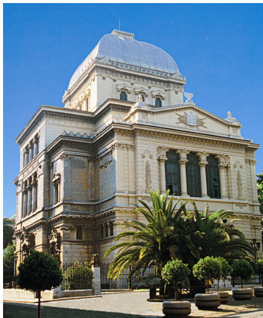
L'edificio della Sinagoga Maggiore di Roma, sede dell'ASCER

L'ASCER conserva, inoltre, una sezione fotografica che comprende immagini dell'epoca del ghetto nei periodi immediatamente precedenti la sua distruzione.