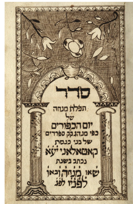
Frontespizio di una Tefillah di Kippur, ASCER

Archivio Storico della Comunità Ebraica di Roma